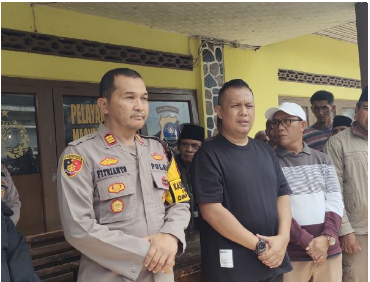
Penyelidikan Kasus Pencurian Kulit Manis Terkendala Ancaman, Kapolsek IV Koto Imbau Warga Kooperatif

IV Koto-Sekitar 100 warga Nagari Malalak Timur, Kabupaten Agam, menggelar aksi unjuk rasa di depan Polsek IV Koto di Guguak Tabek Sarajo pada Minggu (05/01/2025)